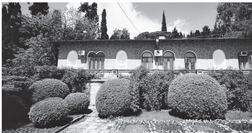
Карасан. Пушкинский дом: в нише - бюст поэта. Построен в 1815 г. М. М. Бороздиным, отцом Анны, обновлен в 1870 г. М. Раевским. Здесь останавливались Пушкин и Н.Раевский-мл. в 1820 году. Соврем. фото.