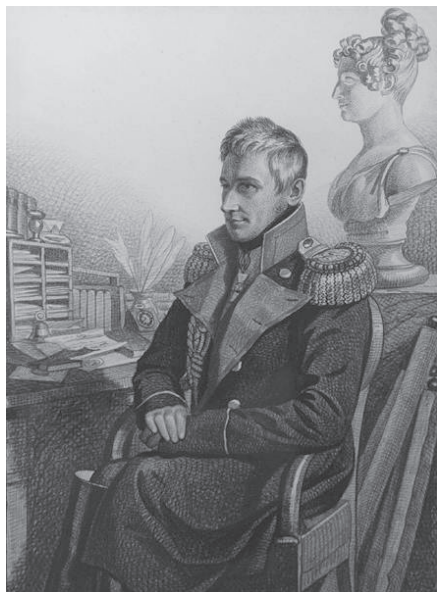
Граф М.С. Воронцов. Гравюра с портрета худ. К.К. Гампельна. 1830-е гг.