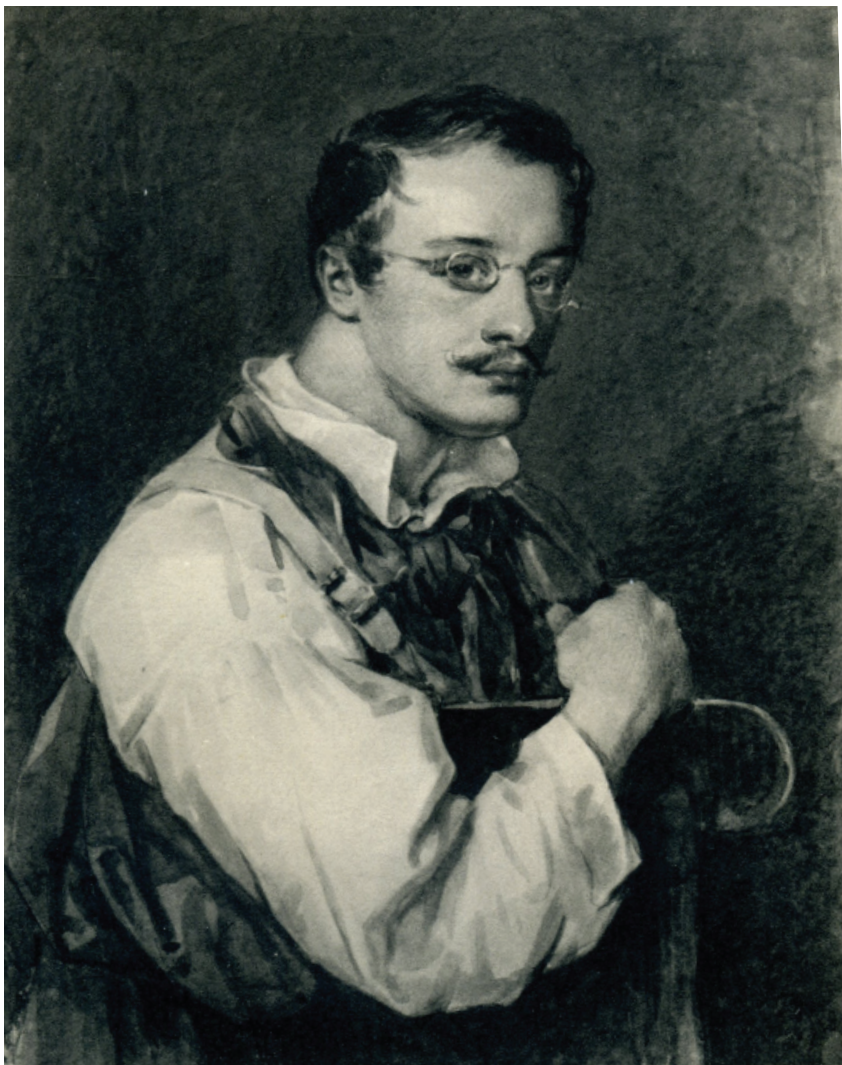
Николай Николаевич Раевский-младший. Худ. П.Ф. Соколов, акварель. 1826 г.