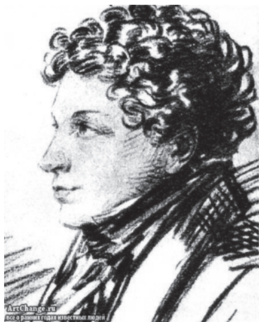
Лев Сергеевич Пушкин – брат поэта, адъютант Раевского-мл.