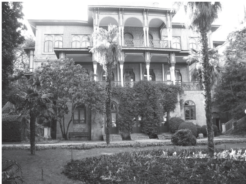
Карасан. Дворец супругов Раевских. Соврем.фото.