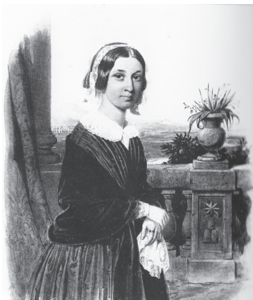
А.М. Раевская. Гравюра с портрета М. Штоль. Рим, 1846 г.