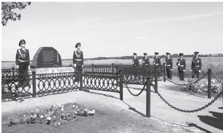
Плита из черного гранита – памятный знак на могиле Н.Н. Раевского-мл., в склепе не сохранившейся церкви, в слободе Красной, Воронежской области. Поставлен 25.09.1995 г.