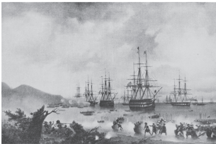
Десант генерал-майора Раевского-мл. 12 мая 1838 г. Флотом командовал вице-адмирал М. Лазарев, на борту флагмана присутствовал художник И.К. Айвазовский, свидетель этой военной операции. Сопровождая картину в С.-Петербург, он представлял ее Николаю 1, о реакции государя подробно сообщает в письме 391. Опубликована в издании «Архив Раевских».