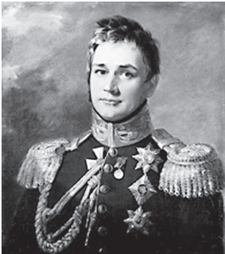
М.С. Воронцов, граф, – генерал-губернатор Новороссии. Худ. Дж. Доу, 1820 г. Военная галерея Зимнего дворца.